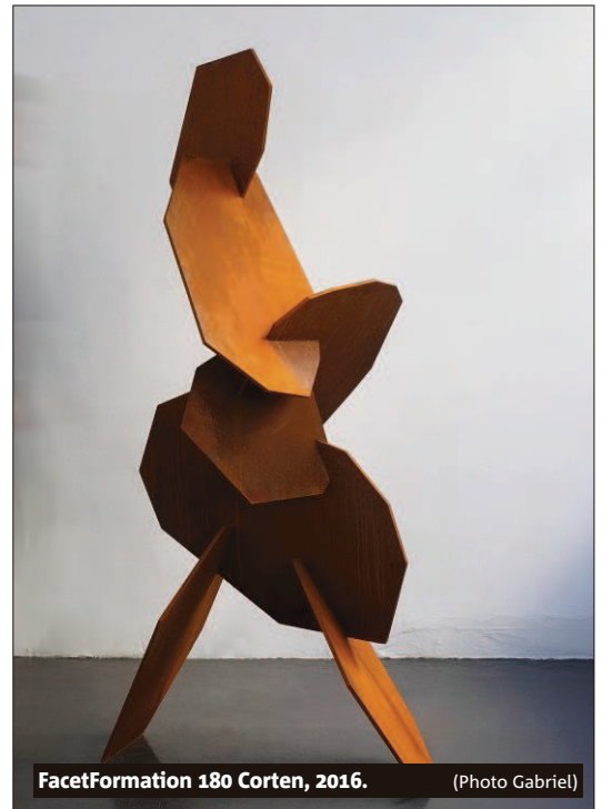
FacetFormation 180 Corten, 2016.