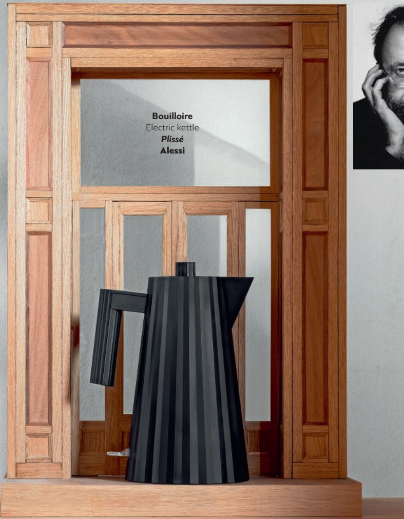
Bouilloire Electric kettle Plissé Alessi