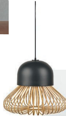
Tables d'appoint Occasional tables Twister Desalto