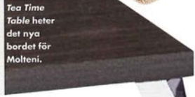
Tea Time Table heter det nya bordet för Molteni.