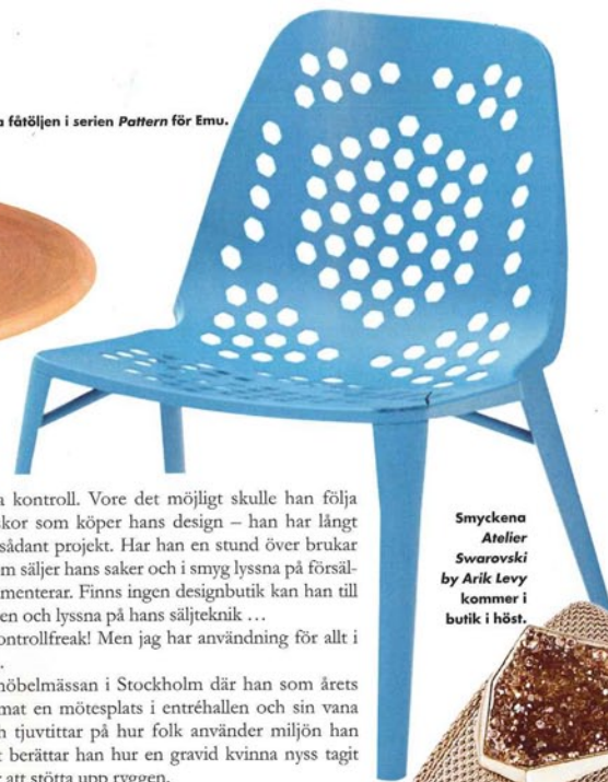
Ny för i år är den låga fätöljen i serien Pattern för Emu.