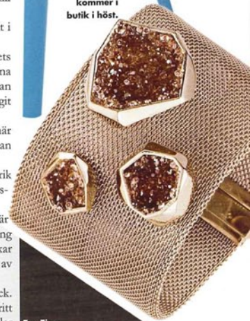
Smyckena Atelier Swarovski by Arik Levy kommer i butik i höst.