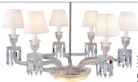
Люстра, Zénith Tourbillon, Baccarat. 2011.